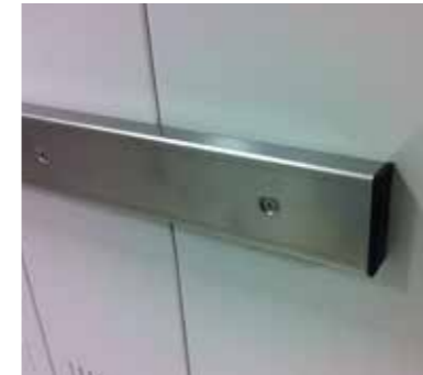
Protecciones metálicas (opcional)