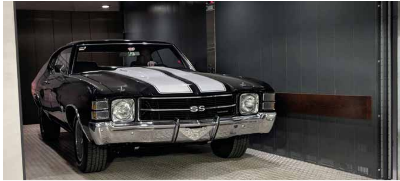
Producto comercializado en USA