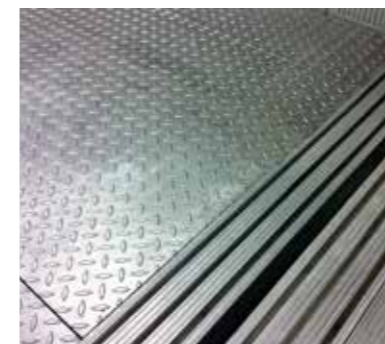
Detalle del suelo estriado