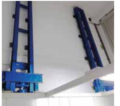
Doble columna lateral (opcional)