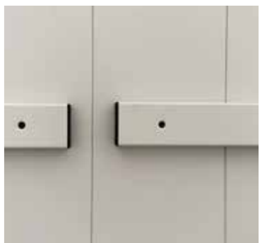
Detalle de las protecciones